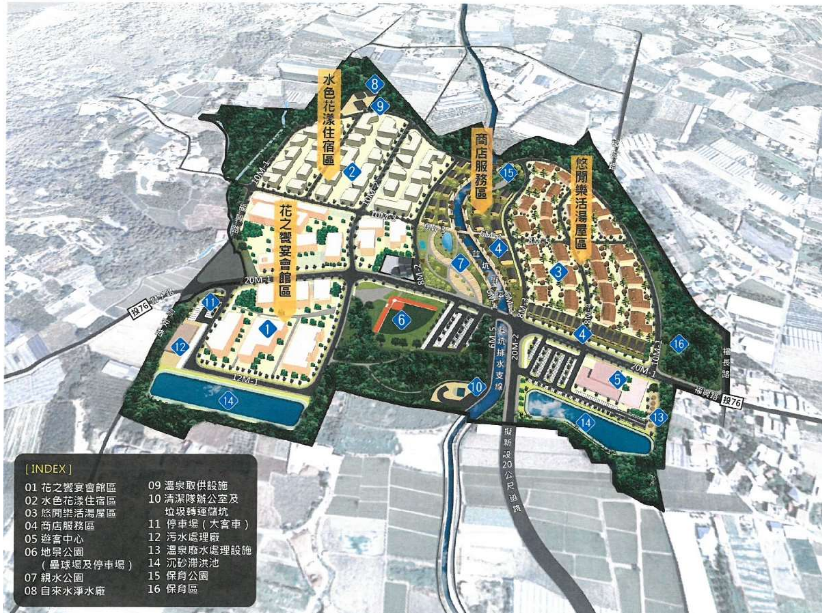
附圖一：建築基地規模及使用性質圖