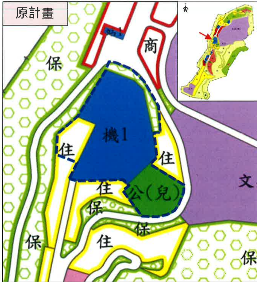
圖 1 變 12 案範圍示意圖