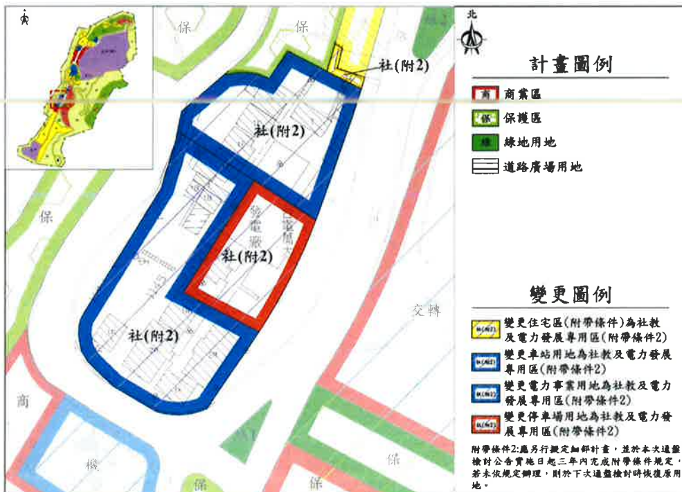
圖 2 變 17 案變更範圍示意圖