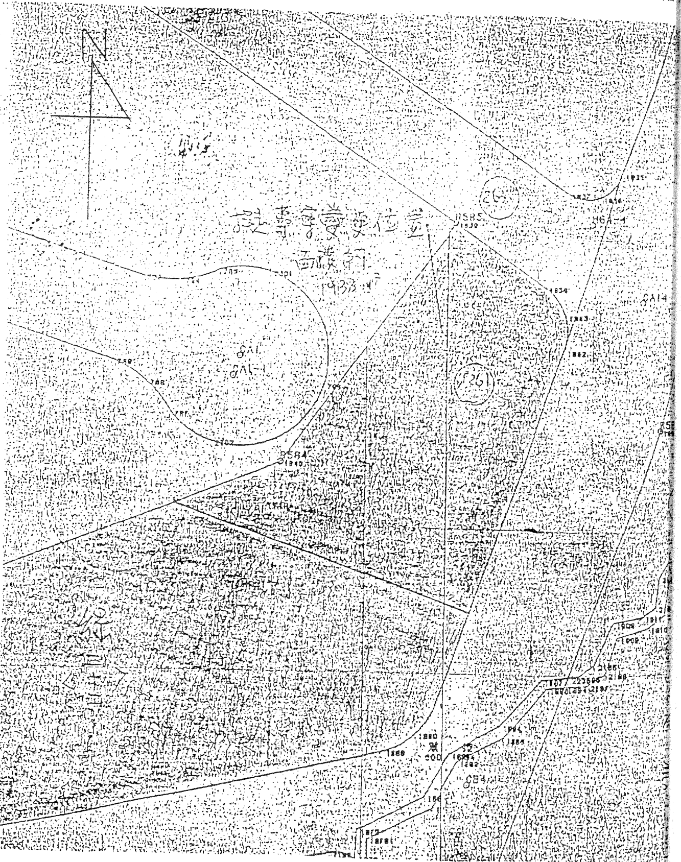
附圖二 變更中興新村(含南內轆地區)都市計畫(部分綠地為住宅區)地籍