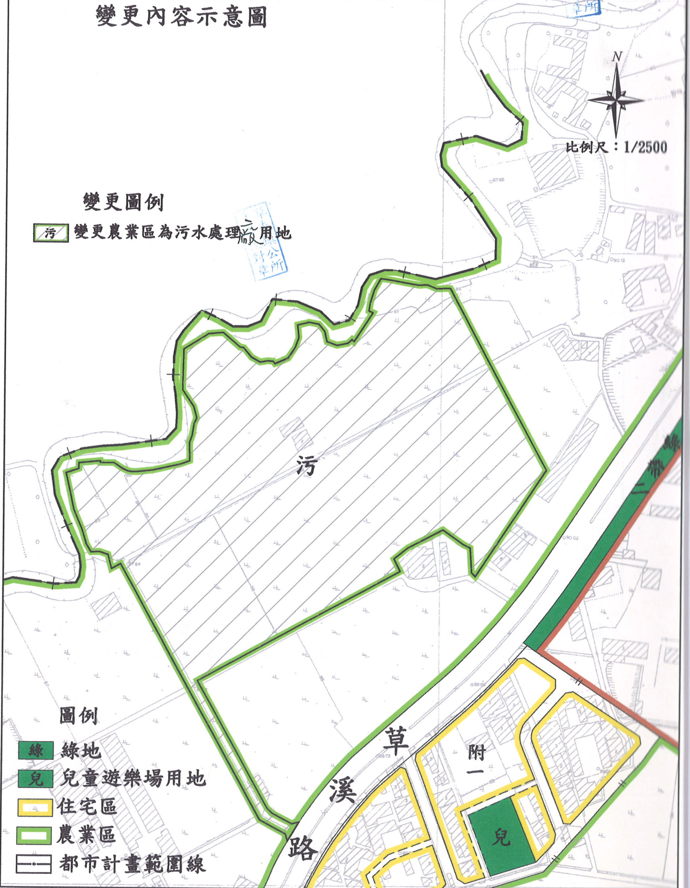
圖四、變更草屯都市計畫(部分農業區為污水處理廠用地)案 變更內容示意圖