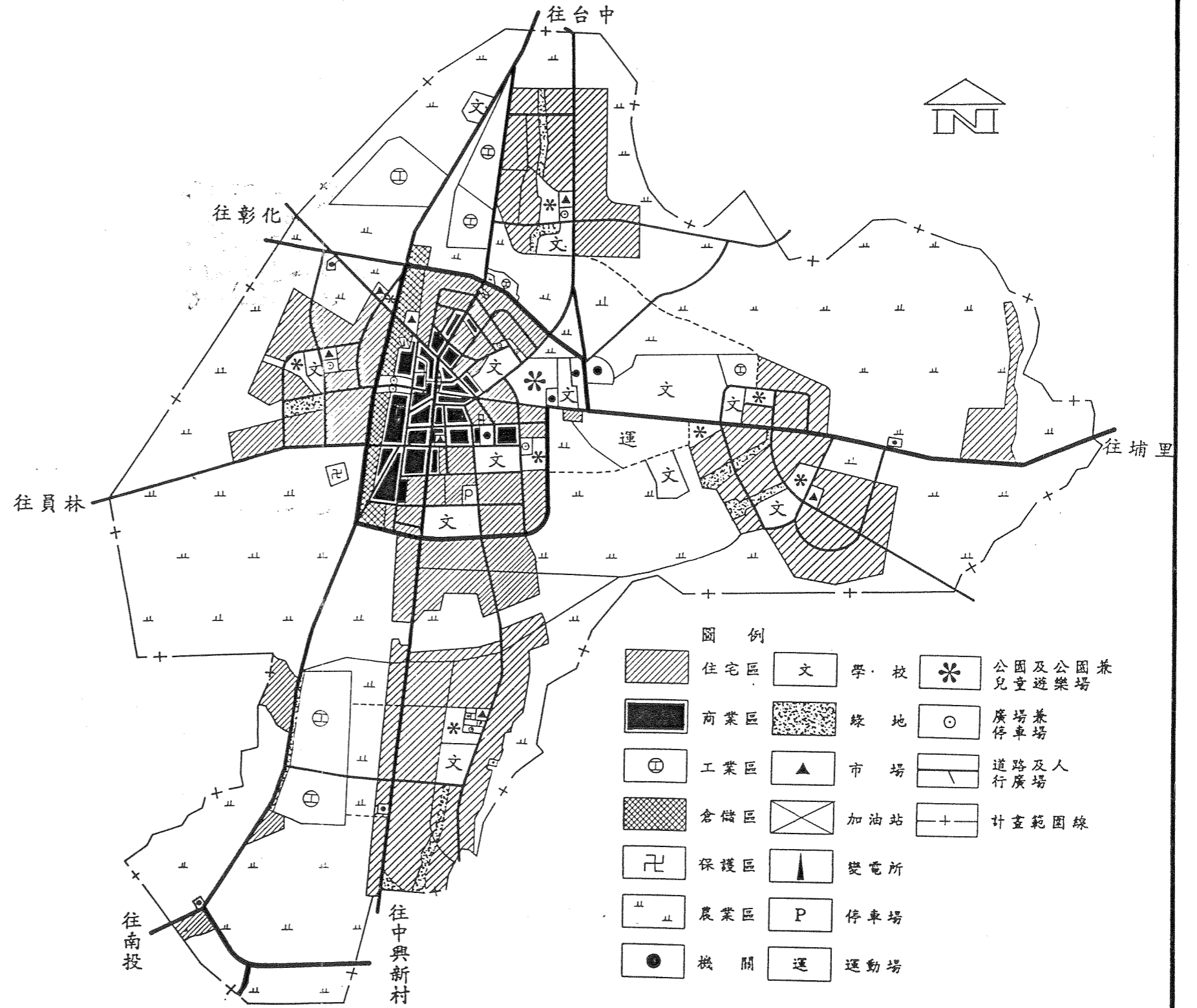
圖二 變更草屯都市計畫(部分道路用地為機關用地、學校用地，部分學校用地、運動場用地、人行步道用地、公(兒)用地為道路用地)示意圖