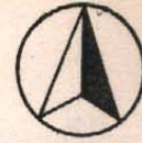
圖 3-1 變更位置示意圖