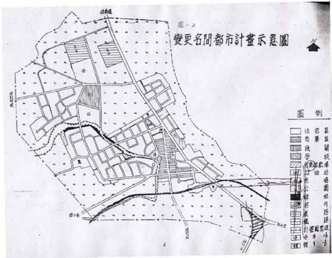
圖二 名間都市計畫示意圖