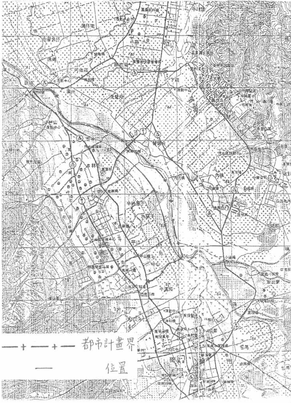
變更南投(南崗地區)都市計畫(部分河川區為農業區、水溝用地,部分農業區為河川區)變更位置示意圖